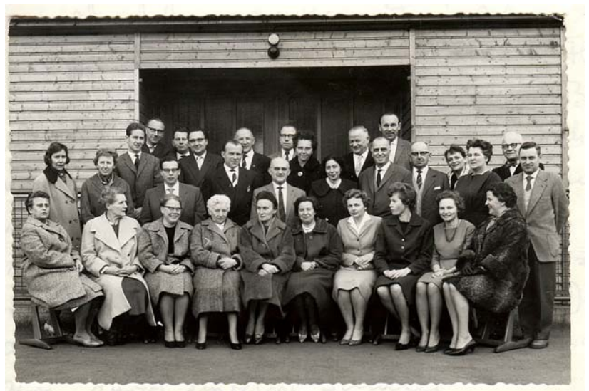
Das Kollegium der noch vereinten Unterliederbacher Volksschule vor der Teilung 1960

Bei herrlichem Wetter feierten die Unterliederbacher vom 22. September 1961 drei Tage