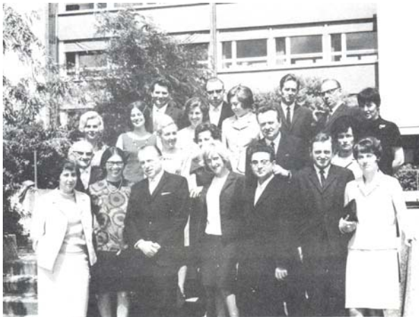
Die 68er: Das Kollegium im August 1968

Zum Schuljahr 1969/70 ging die Walter-Kolb-Schule (mit zwei anderen Frankfurter